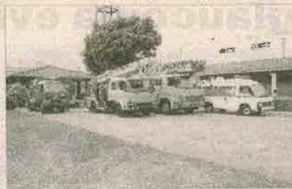
Autobombas y autocarroceros que se harán entrega oficialmente la próxima semana.

Una asociación con los cuales contribuyen ya están