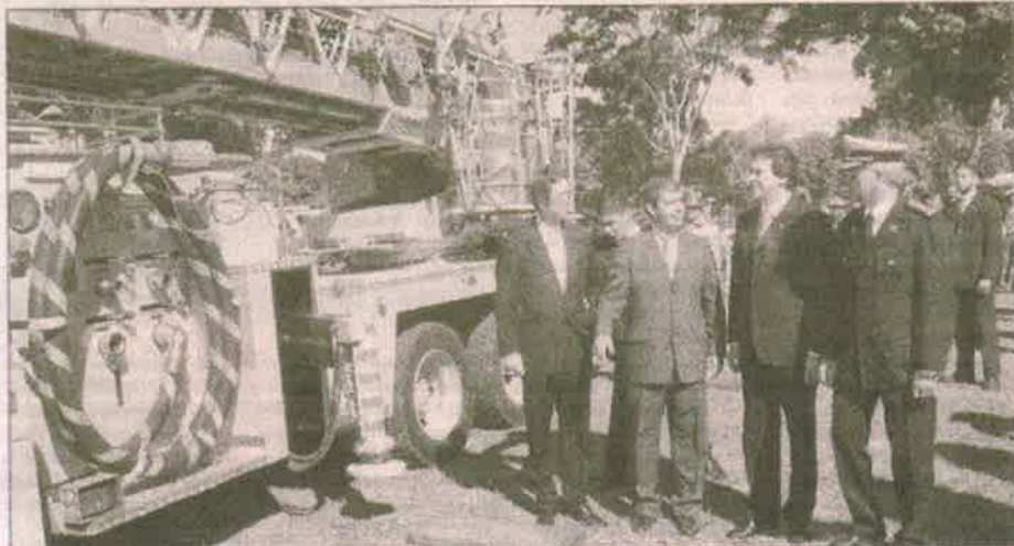
El ministro Rogelio Benítez y Riera presiden el acto de entrega de los camiónbombras y autocascas

Riera aprovechó el acto para defender los viajes al extranjero donde se consiguen "cooperaciones que salvan vidas y arreglan calles".