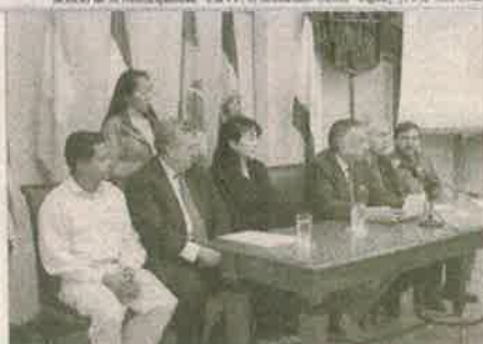
Algunos de la banda de prensa realizada al viernes en la Municipalidad de Encarnación para anunciar la donación.