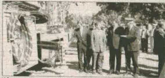
Velocidad. El presidente Iino y el vicepresidente Ito rodeados por uno de los camiones de bomberos.

El embajador japonés, Kenta Iino, aclaró que este aporte se enmarca en una ayuda financiera no reembolsable que coincide con el 70º aniversario de la llegada de los primeros inmigrantes de esa nación que se cumple este año.