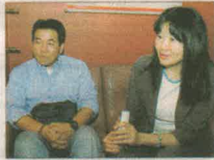
Donantes. Los técnicos de la asociación que donó los equipos durante su visita a Última Hora.

Los bomberos también recibirán una bomba que les ayudará a mantener la presión del agua cuando tienen que enfrentar un siniestro.