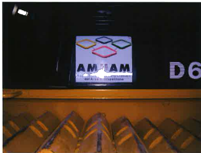
贈ったブルドーザーに付けられた AMUAM のマーク