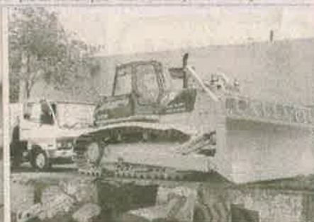
El día en la topadora que beneficiará a los municipios del área metropolitana.