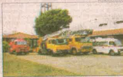
Origen. Las máquinas se destinaron a los bomberos y a los municipios de Asunción, Encarnación, Minga Guazú e Isla Itaipu.

La ayuda también alcanzó al Cuerpo de Bomberos Voluntarios del Paraguay (CBVP) con diez escudos y dos