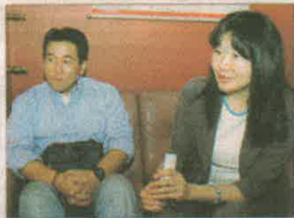
Donantes. Los técnicos de la asociación que donó los equipos durante su visita a Última Hora.

Los bomberos también recibirán una bomba que les ayudará a mantener la presión del agua cuando tienen que enfrentar un siniestro.