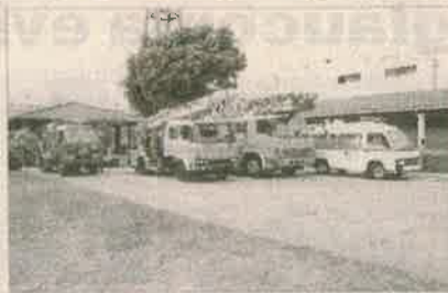
Autobombas y ambulancias que el Japón entregará oficialmente la próxima semana.