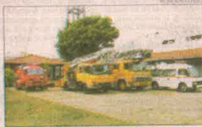
Origen. Las máquinas se destinan a los bomberos y a los municipios de Asunción, Encarnación, Minga Guazú e Isla Itaipu.

La ayuda también alcanzó al Cuerpo de Bomberos Voluntarios del Paraguay (CBVP) con dos escuelas y dos