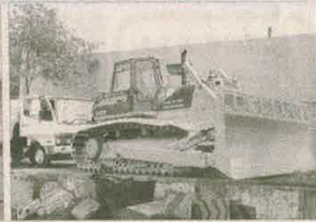
PAÍS ASUNCIÓN SABADO 20, MAYO 2006