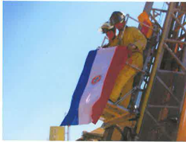
セレモニーのデモンストレーションで はしご車からパラグアイ国旗を掲げる消防隊員