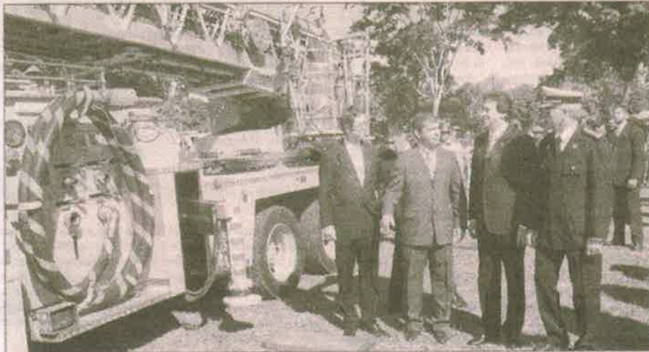
El ministro Rogelio Benítez y Riera presenciaron el acto de entrega de los carrobombas y autobuses.

Riera aprovechó el acto para defender los viajes al extranjero donde se consiguen "cooperaciones que salvan vidas y arreglan calles".