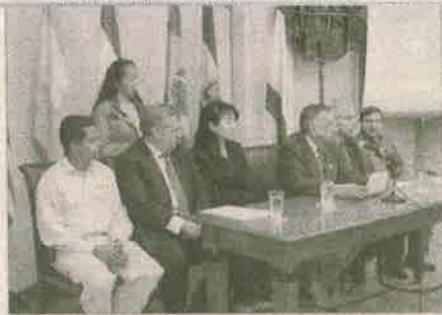
Agencia de prensa de prensa realizada por el secretario de la Municipalidad de Asunción para anunciar la donación.

Los beneficios que los cuatro autobombas ya están en una reunión por esta donación realizada por beneficio de la ciudadanía que presta el Cuerpo de Bomberos, ya que son donados equipos de punta.