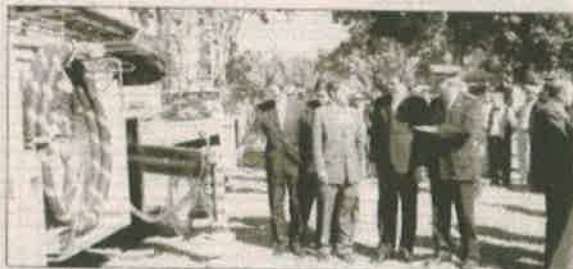
Valiosa ayuda. Un reciente viaje al extranjero sirvió de base para la donación de los carros de bomberos.

El embajador japonés, Kenji Iino, al dar este aporte se encuentra en una visita humanitaria en el momento que coincide con el 70º aniversario de la llegada de los primeros inmigrantes de esa nación que se cumple este año.