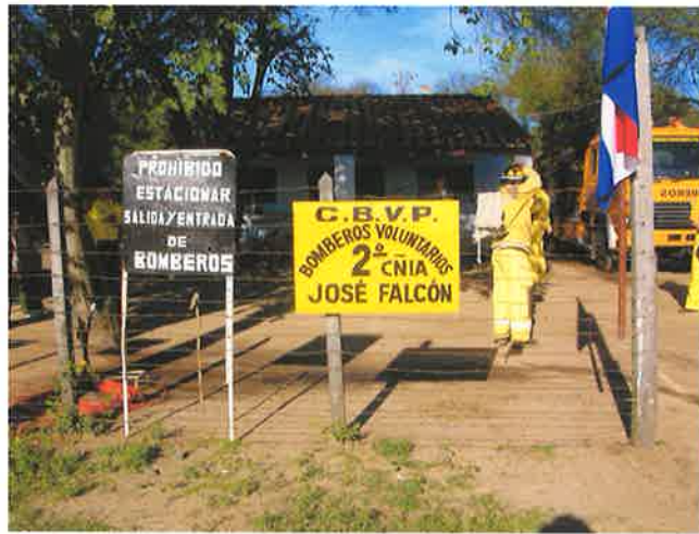
パラグアイ消防隊 ホセ・ファルコン署