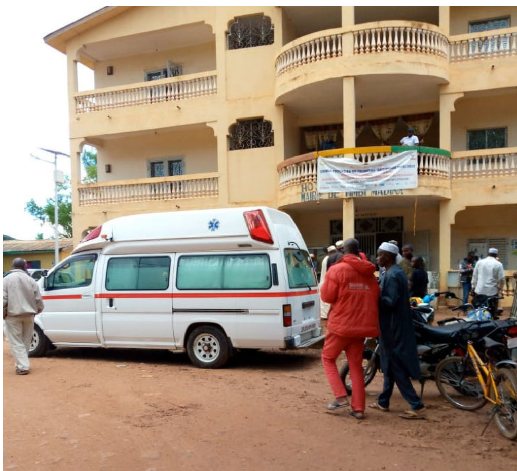
ティンビ・マディナ庁舎へ到着した救急車