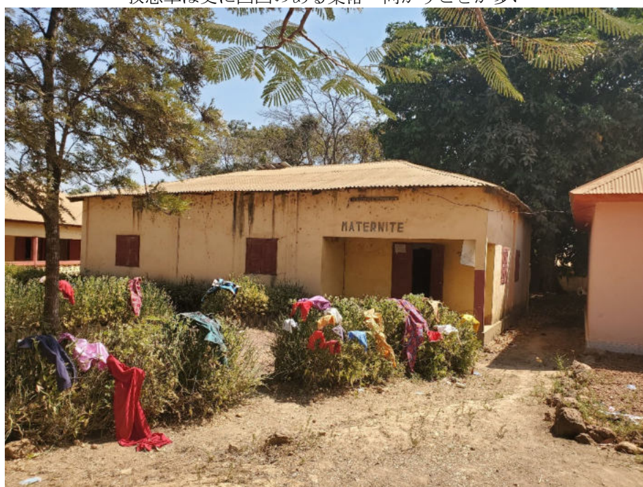
出動要請の多いマタニティクリニック