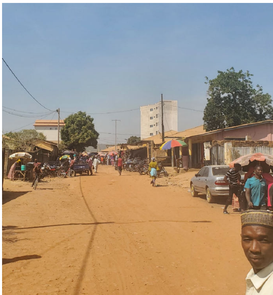
ティンビ・マディナ市街地 救急車は更に凹凸のある集落へ向かうことが多い