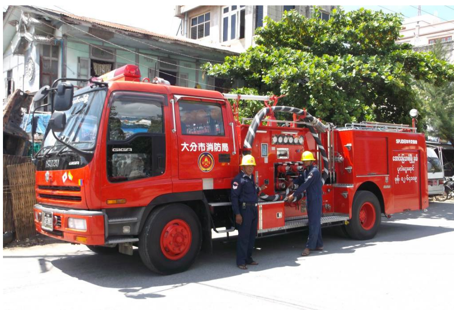
配備された消防車