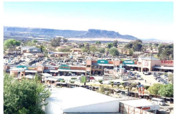
標高 1400m 以上に位置するマセル市中心街