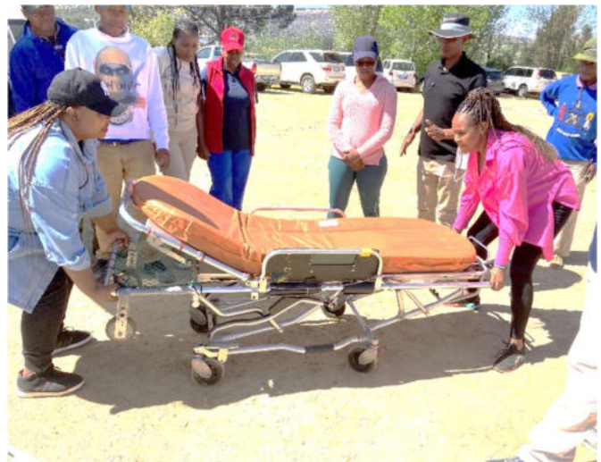
救急車への患者搬送手順を確認