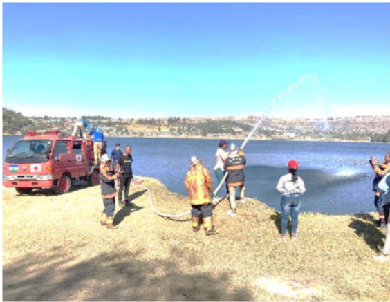
市内貯水槽施設を利用した放水訓練