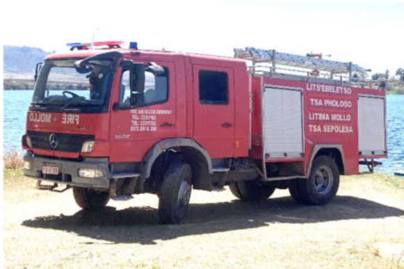
マセル市が唯一保有している消防車