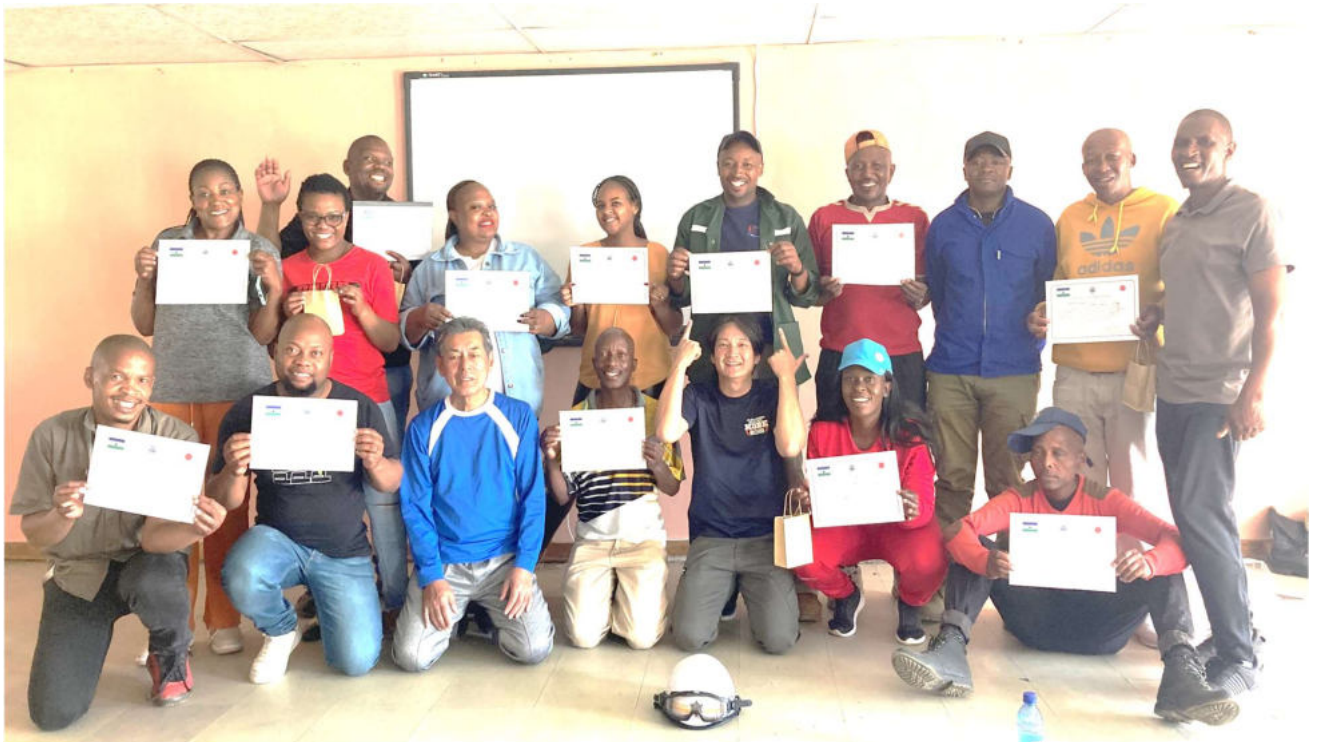
研修修了式 マセル市の消防・救急職員たち