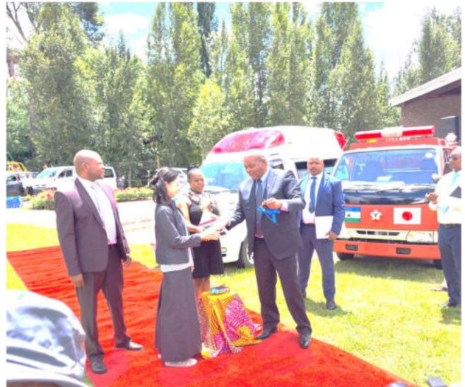
在レソト日本国大使館（在南アフリカ共和国日本国大使館兼轄）引渡し式