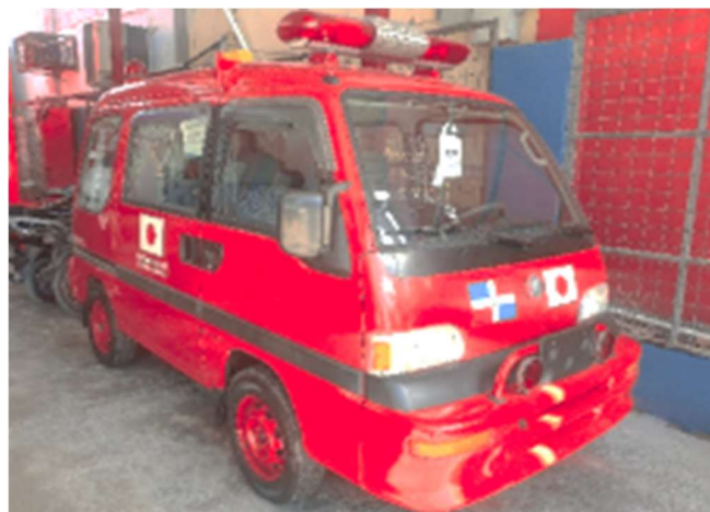
供与された4WD小型ポンプ積載車 (逗子市ご供出)