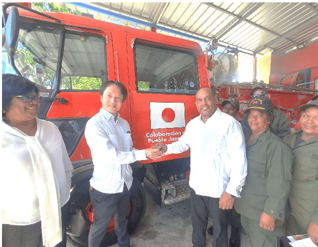
ドミニカ共和国 タマジョ市グレイシ・ラミレス市長（中央右）へ車両キーを引き渡す 在ドミニカ共和国日本大使館 古川 忠雄 参事官