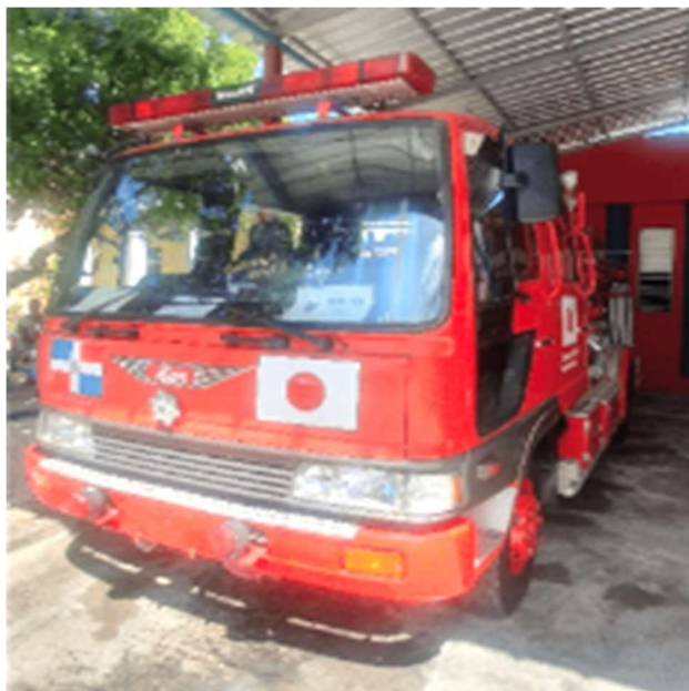
供与された水槽付ポンプ車 (神戸市ご供出)