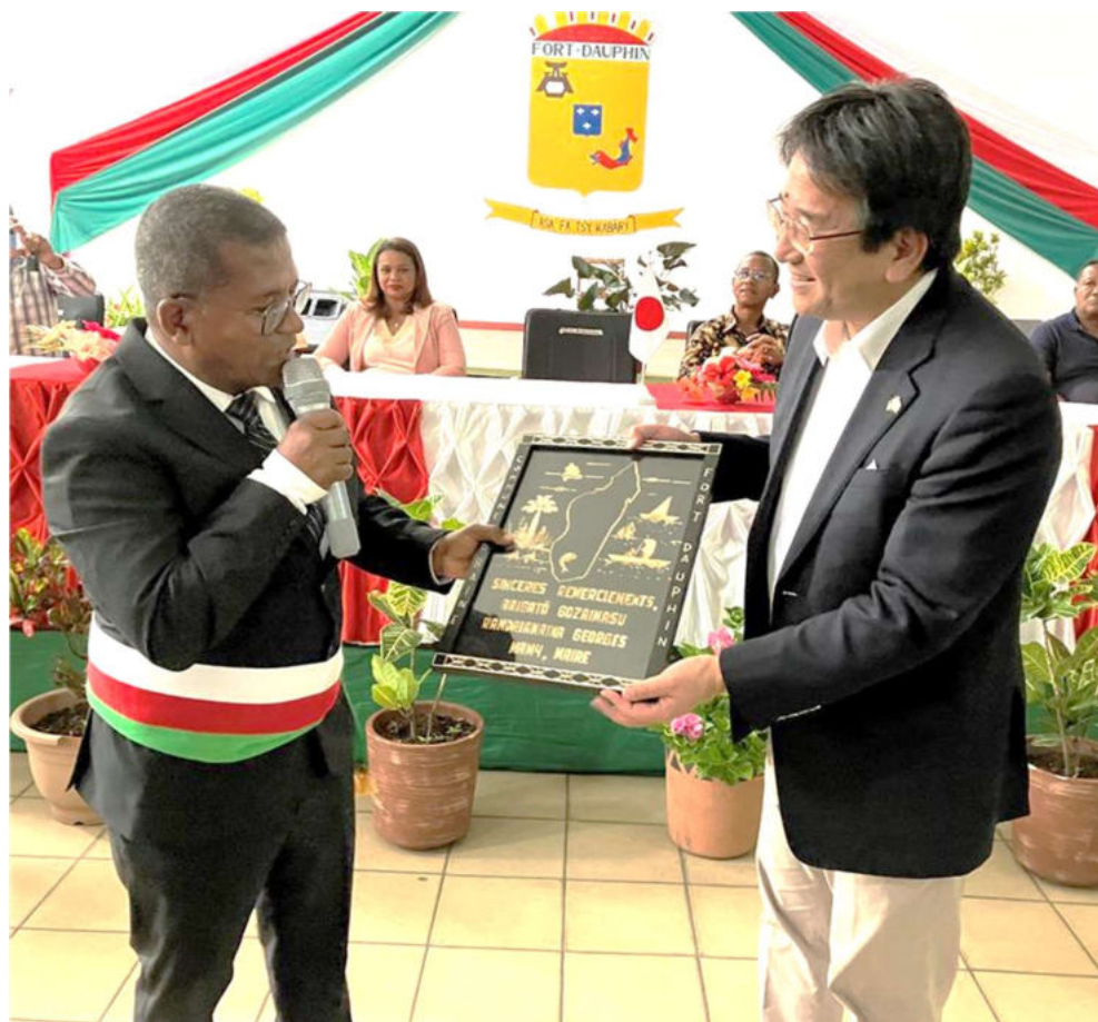
マミー市長から阿部大使への感謝状贈呈