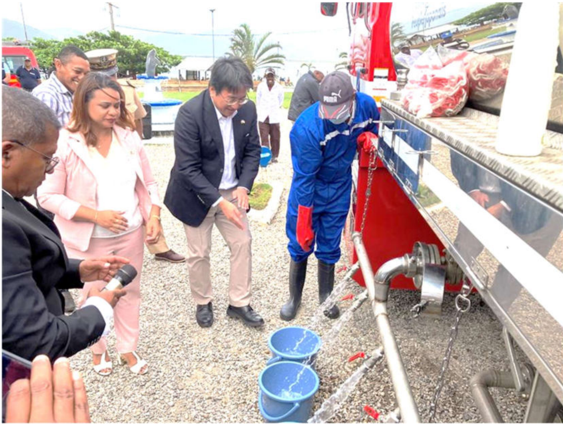
阿部大使へ給水方法を説明する職員