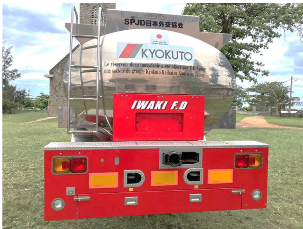
極東開発工業（株）より供出を受けを整備されたステンレス製タンク