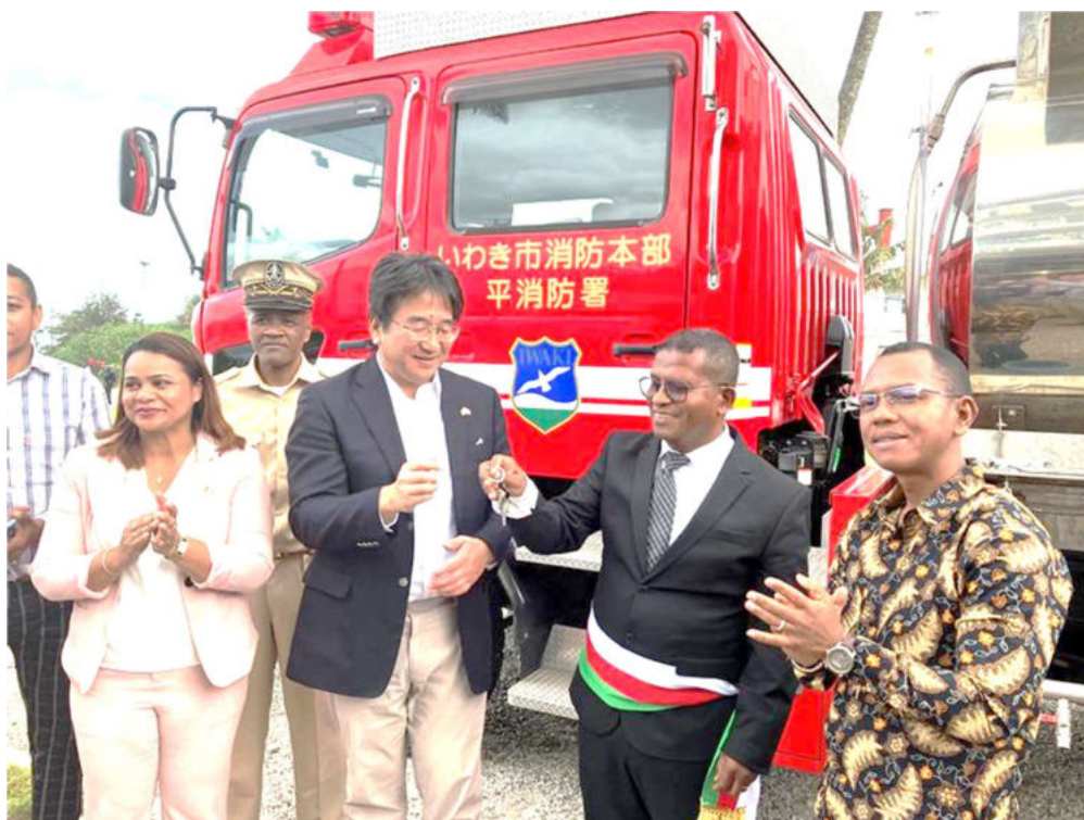
マダガスカル国フォール・ドーファン市ランドリアナイナ・ジョルジュ・マミー市長（中央右）へ車両キーを引き渡す駐マダガスカル兼コモロ国駐箚 阿部康次 特命全権大使