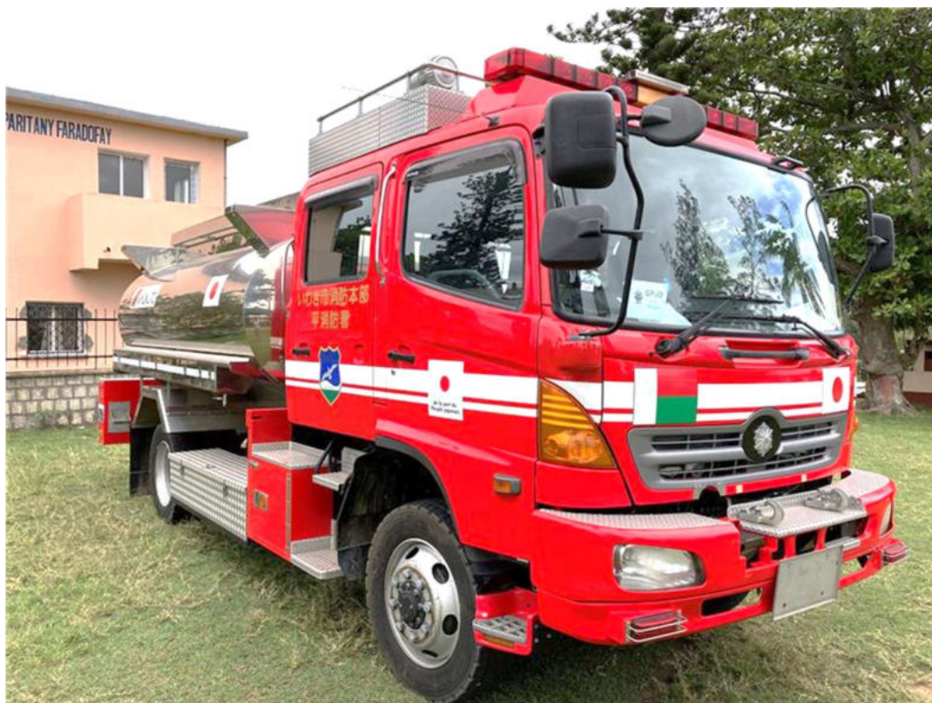
寄贈された給水車（車台はいわき市ご供出）