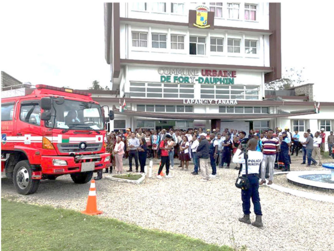
フォール・ドーファン市民に歓迎される給水車