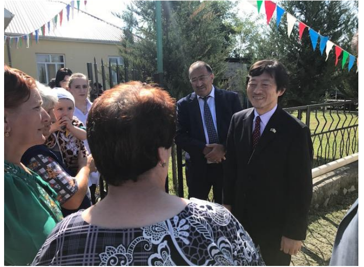
香取大使に謝意を伝える住民