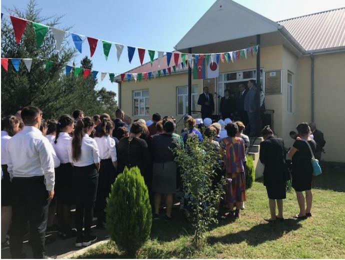
式典に集まった住民