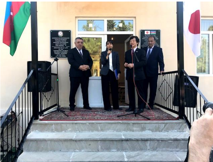
香取大使による挨拶