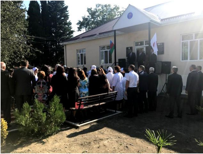
式典に集まった住民