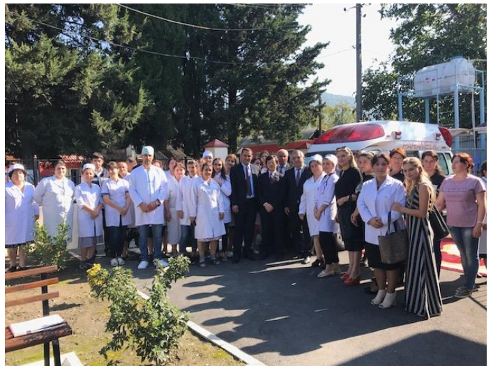
診療所スタッフとの記念撮影