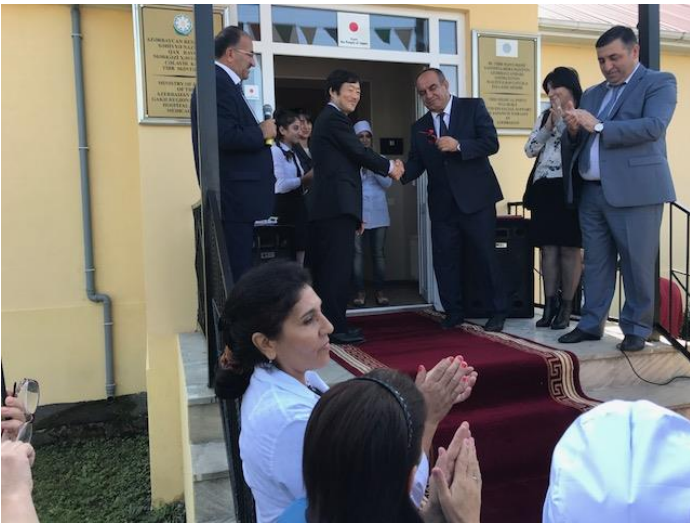
香取大使による挨拶