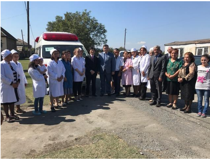
診療所スタッフとの記念撮影