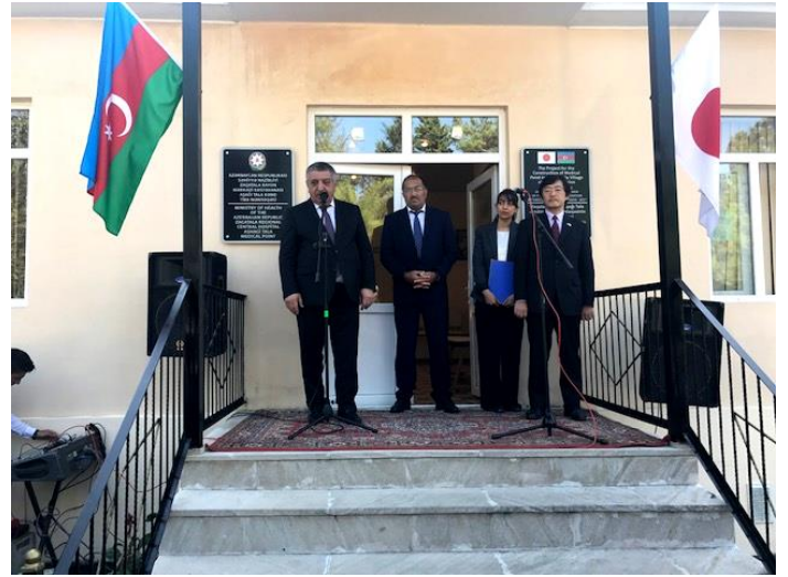
ザガタラ地区行政局アフメドザーデ行政長による挨拶