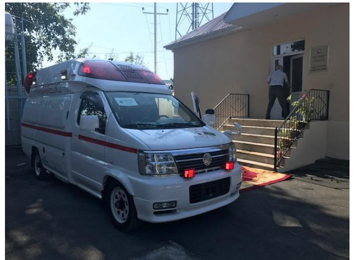
供与された救急車