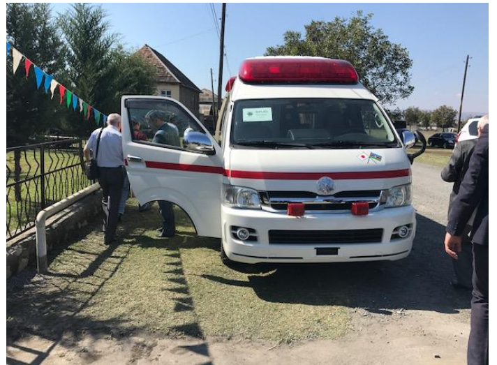
供与された救急車