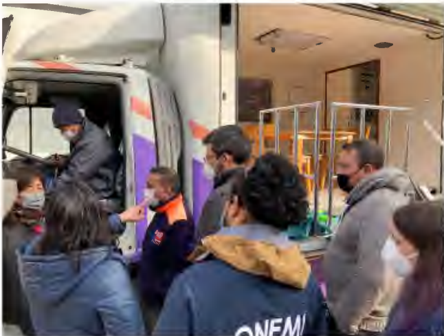
キャブ内操作の説明