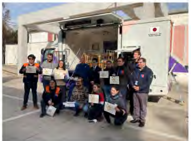
ONEMI 運用スタッフ一同