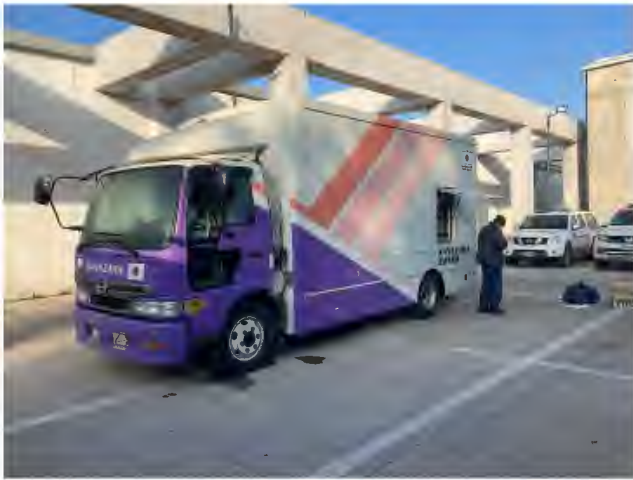
到着した地震体験車

2022年7月コロナ禍の難しい海外出張となりましたが、チリで地震体験車の取り扱い・メンテナンスに係る研修を実施しました。