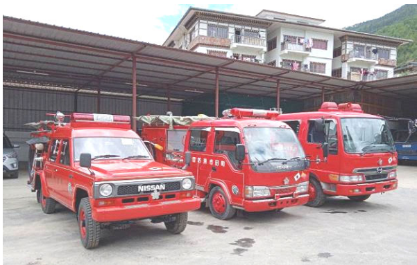
左から町田市（2台）、東広島市供出の消防車