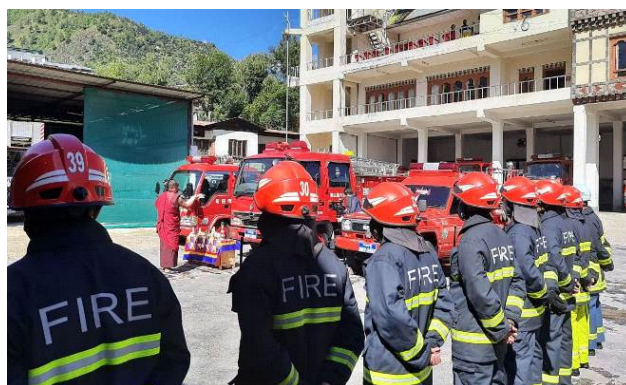
式典に臨む消防士達