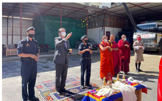
関係者による祈願の様子