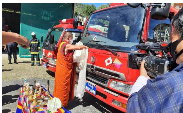
報道の前で寄贈を祝す様子